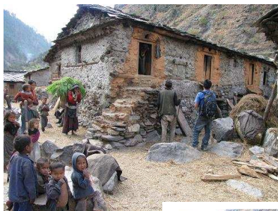
La maison de Rajan