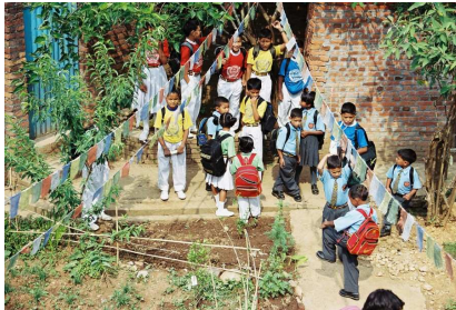
Prêts pour la journée sportive !

Tous les élèves de l'école sont répartis en six groupes, de couleurs différentes, mixtes et avec toutes les classes de l'école représentées de façon homogène. Cette compétition permet de déterminer le meilleur de ces groupes.