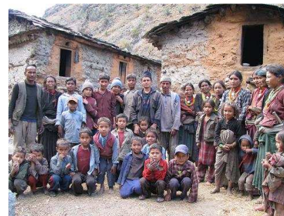
Les habitants de son village